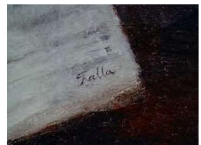
Detalles del estado previo y del proceso de restauración del lienzo

MÚSICA Y PINTURA EN EL REAL CONSERVATORIO