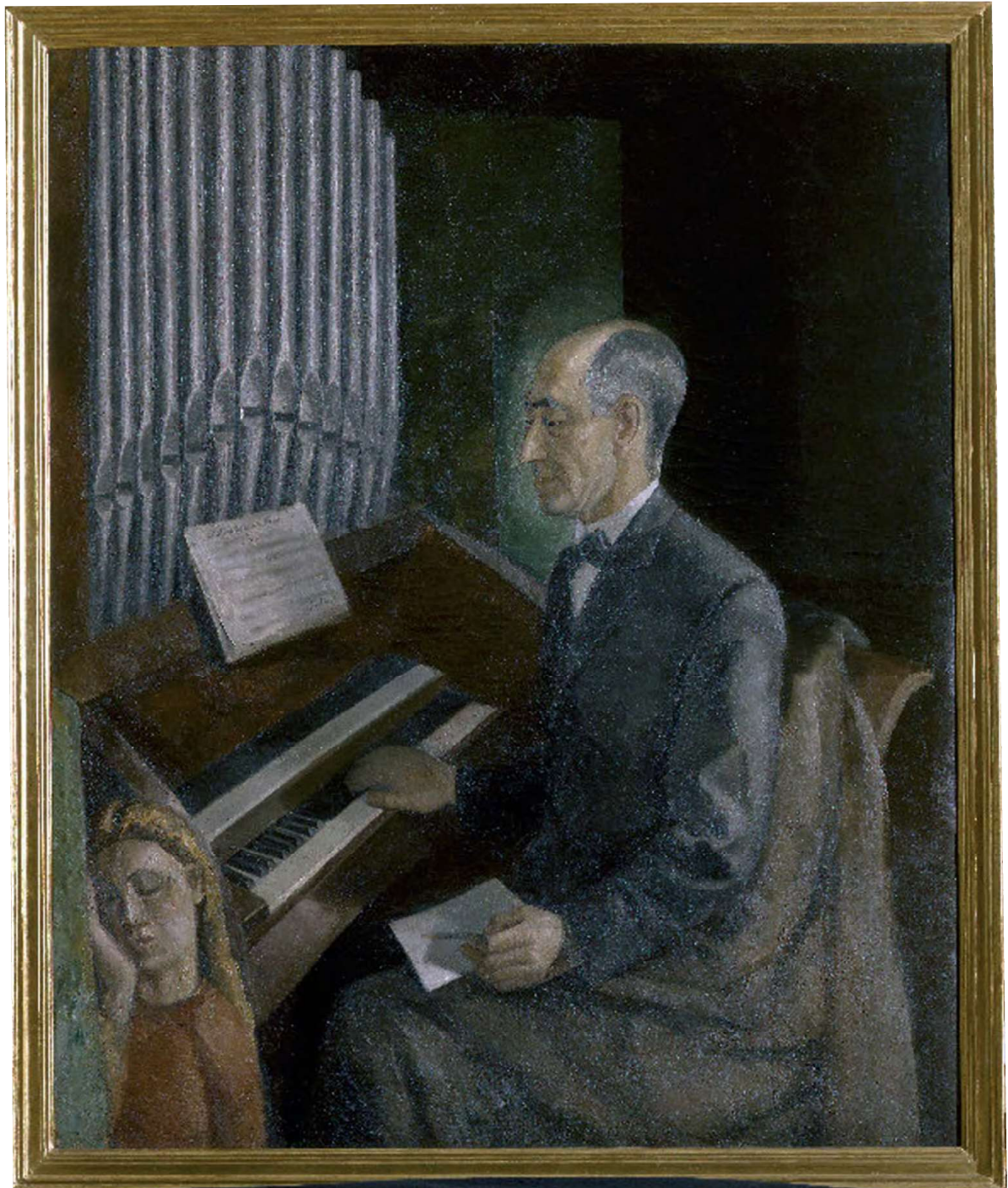
“Retrato de Falla”, Daniel Vázquez Díaz

MÚSICA Y PINTURA EN EL REAL CONSERVATORIO